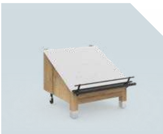
VITALO Elément mural