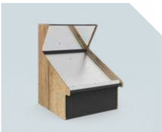
VERDE Élément mural 1 niveau avec miroir