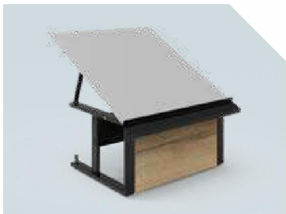
VITA Elément mural 1 niveau – soubassement fixe