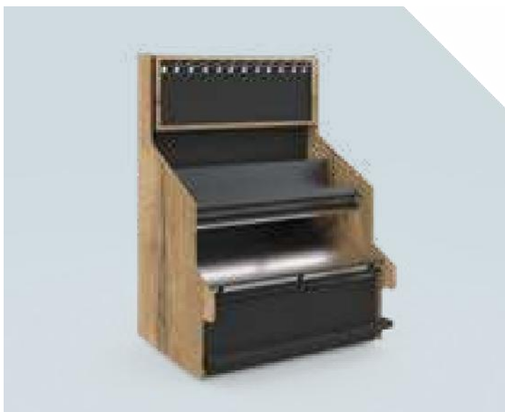
VERDE Etagère plantes aromatiques