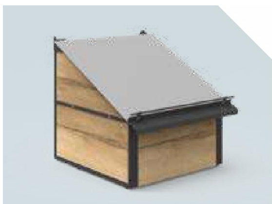
VITA Elément mural Habillage latéral 2 éléments – soubassement fixe