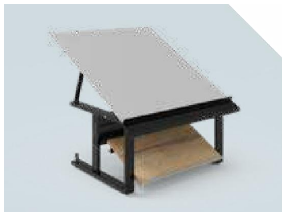
VITA Elément mural 1 niveau – soubassement basculant