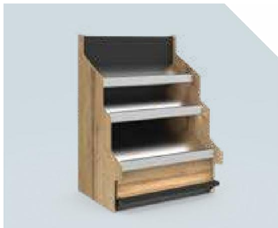
VERDE Élément mural 3 niveaux