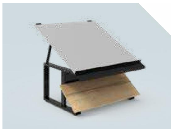
VITA Elément mural 1 niveau, sans habillage latéral