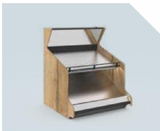
VERDE Élément mural 2 niveaux avec miroir

VERDE – le système modulaire pour une présentation élégante et efficace.