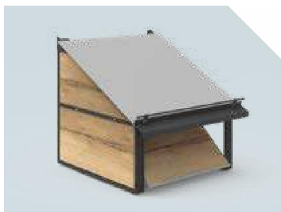
VITA Elément mural Habillage latéral 2 éléments – soubassement basculant