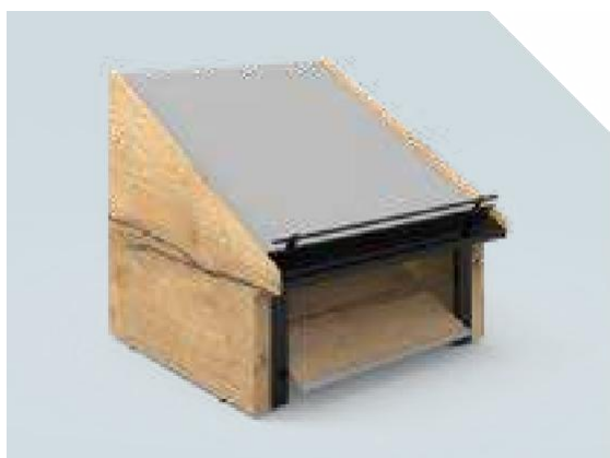
VITA Elément mural 1 niveau, Habillage latéral 1 élément