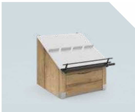
VARIANT Elément mural