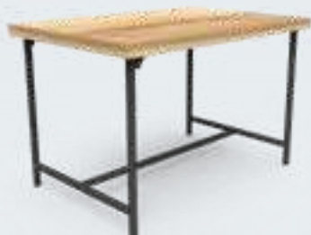
TABLE SIMPLE 1 plateau

Quand la flexibilité rencontre la fonctionnalité – des espaces promotionnels qui font la différence.