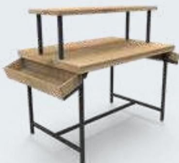
TABLE 2 NIVEAUX 2 plateaux