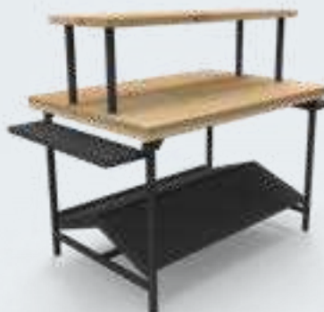
TABLE 3 NIVEAUX 2 plateaux, 1 présentoir incliné