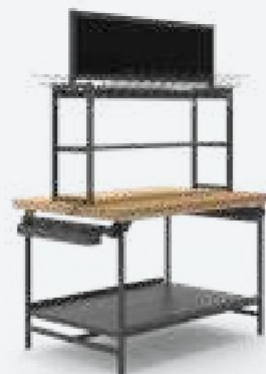
TABLE DE PRESENTATION