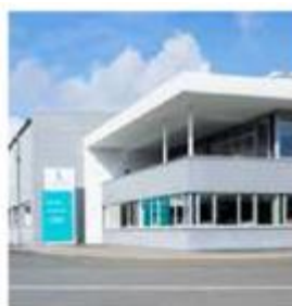
📍 BAD HERSFELD ZENTRALE