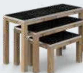
TABLE GIGOGNES Avec fond étanche