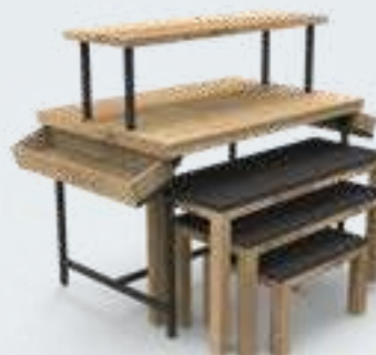
TABLE 2 NIVEAUX Saisonnal 2 plateaux + 3 tables gignognes