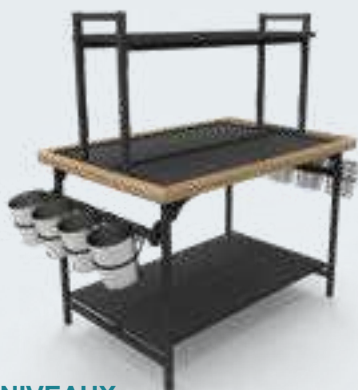
TABLE 3 NIVEAUX Fleurs (avec pots)